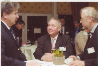
Das Portalprojekt hilft beim Knüpfen neuer Kontakte.

Engel Food Solutions verarbeitet pro Jahr 100.000 Tonnen Kartoffeln – unter anderem zu Kartoffelgranulat, das zum Beispiel als Basis für